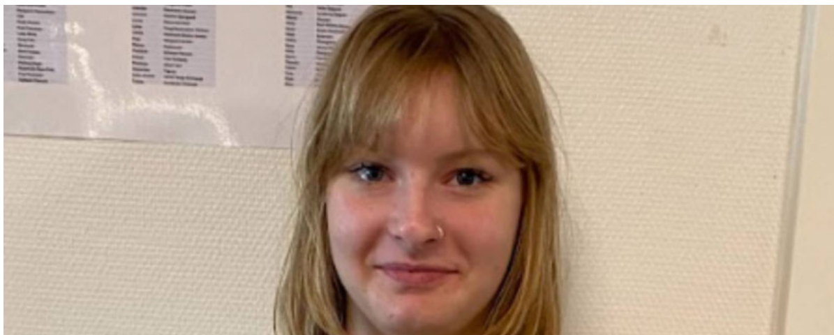
◦ Elev på Lystruphøve efterskole.