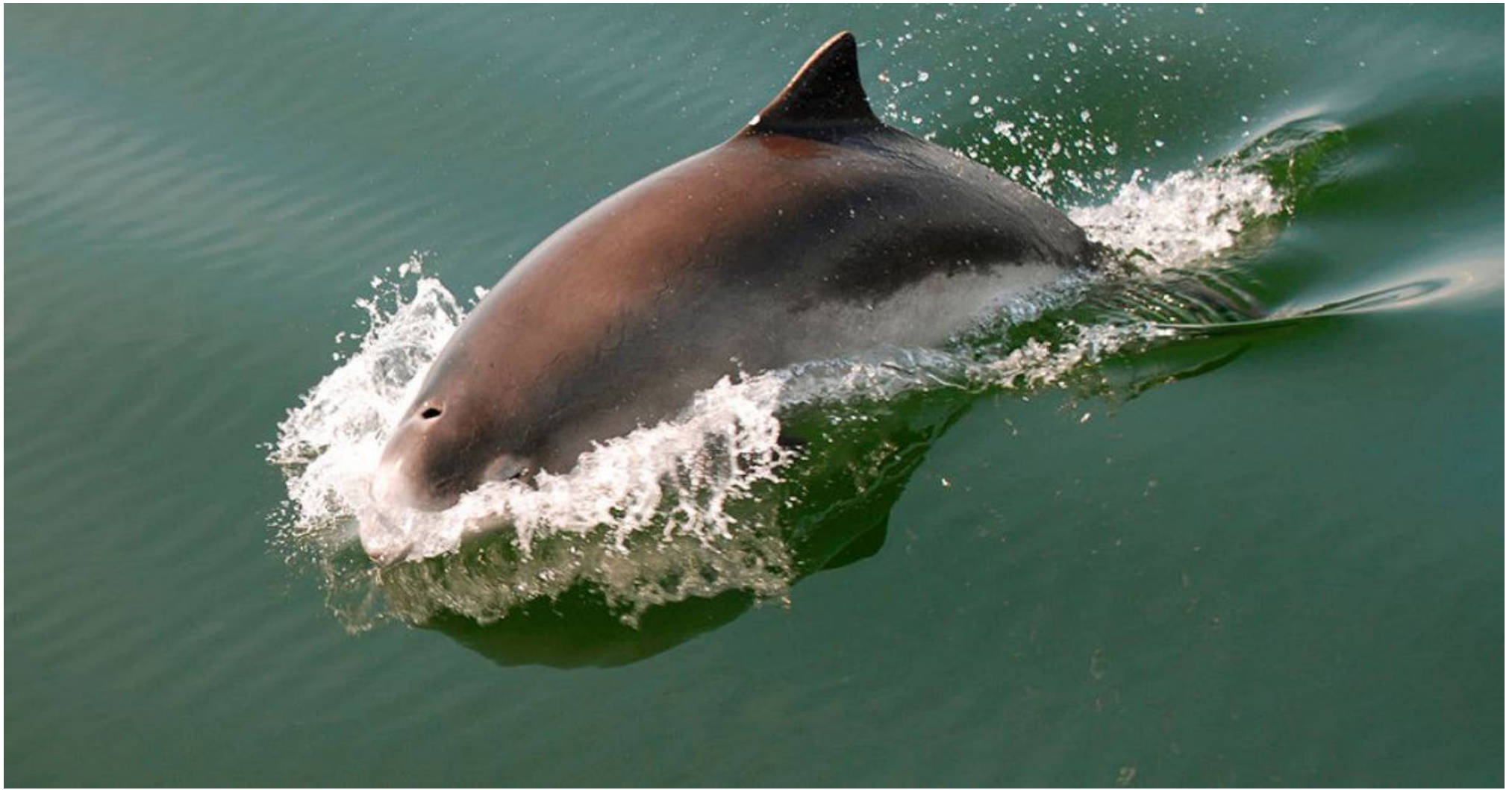
Marsvin i Lillebælt