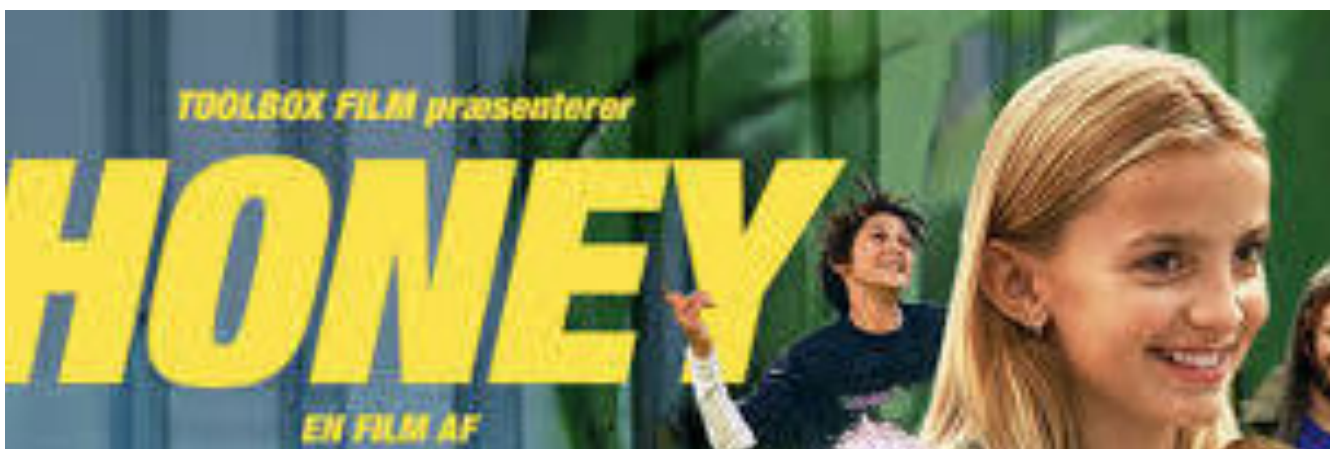
Filmen Honey kom ud den 6. Februar

arbejde. Vi har et kontor i København, hvor vi sidder 35 medarbejdere og arbejder på de samme artister. Så det er alt fra dem, der booker koncerterne, dem der lejer udstyr til koncerterne, dem der sørger for regnskab til min afdeling, som sørger for at sælge billetter.