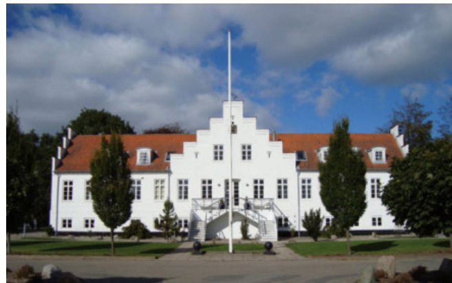
Billeshave efterskole

Af Layan Marmar, Viola Vædele-Larson og Linus Sejer Revsbech Jensen