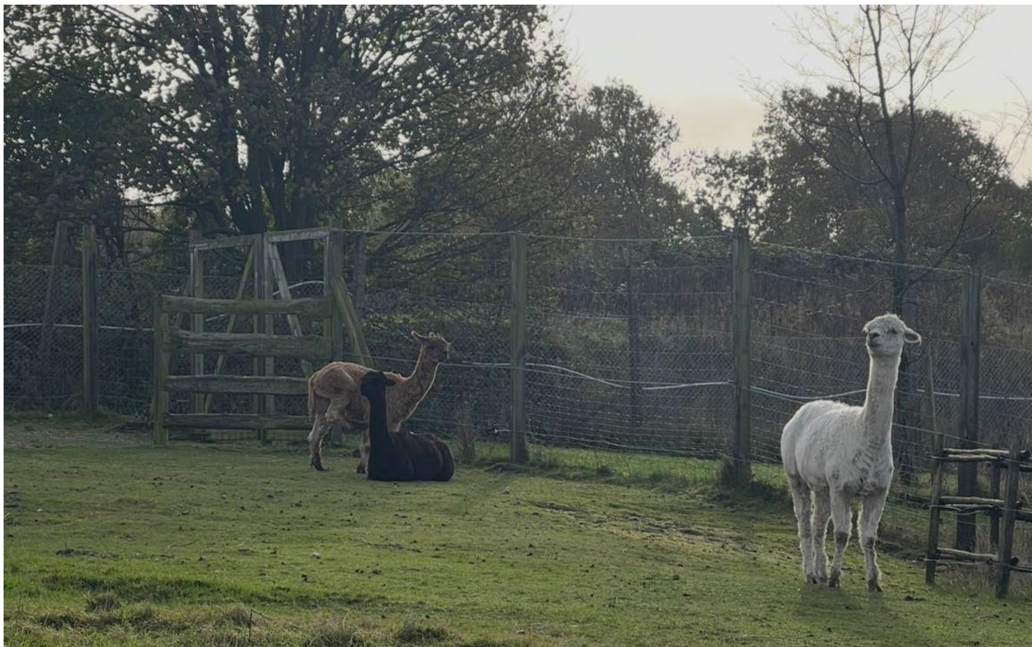
Lamaerne hygger sig i glad zoo