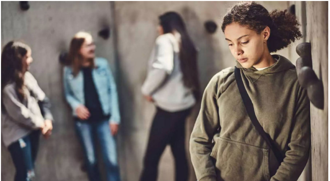
Nogen gange kan ens handlinger betyde mere end man tror