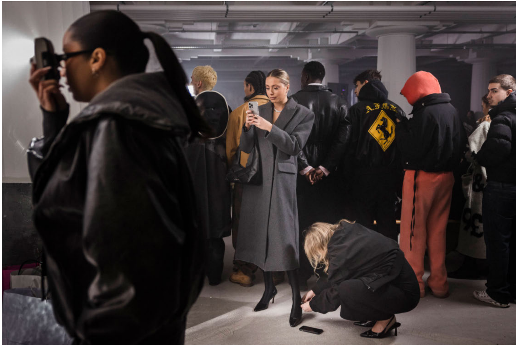
Modeshow med tøj fra Han Kjøbenhavn i Carlsberg Byen.

Der er mange forskellige religioner, fx der er kristendommen, islam, hinduismen, buddhismen og jødedommen. Hver religion tror på noget forskelligt, kristendommen tror på gud og Jesus og skal oftes konfirmeres, men det kan også være at ens religion ændre på ens livstil, og hvad man kan og ikke kan, fx ikke kunne have et stykke tøj på, eller alt muligt andet der er også nogen der ikke har religion, men tror på videnskaben, eller har deres helt egen tro. Der er selvfølgelig også nogen, der tror på både, fx kristendom og videnskaben. Ens religion kan også betyde, hvad man synes er rigtigt og forkert, som fx om man synes, at abort er okay. Der er mange, der synes, det er okay, men nok også lige så mange, der ikke synes det er okay. Og så er der også det med at vores tro skaber arbejde, for man kan jo arbejde som fx præst, og vores tro har betydet meget i fortiden, som fx da Danmark blev protestantisk.