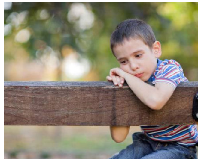
Vi har valgt dette billede fordi det viser en nervøs dreng og man kan også se at drengen går meget ind i sig selv

Da jeg var cirka 14-15 år, fik jeg sådan en dårlig vane. Jeg begyndte, helt uden at tænke over det, at gemme min hånd f.eks. bag et net eller i ærmet, så det påvirkede mig jo en del på den måde, at jeg faktisk var flov og jeg var jo aldrig kommet ind i parre sporten hvis ikke det var for min hånd så det har jo på den måde været en kæmpe mulighed for mig jeg har altid været en meget stædig pige så jeg har altid villet kunne det samme selv om jeg mangler en hånd det skulle i hvert fald ikke forhindre mig i at gøre det jeg gerne vil. Her er der lidt fakta om PL. De paralympiske lege organiseres af den Internationale Paralympiske Komite (IPC). De paralympiske lege afholdes i samme by som OL kort tid efter de olympiske lege. Danmark har deltaget siden 1968 og har siden haft stor succes især siden de paralympiske lege i 1984 i New York. legene er blevet målt som det tredje største sports event efter OL og VM i fodbold